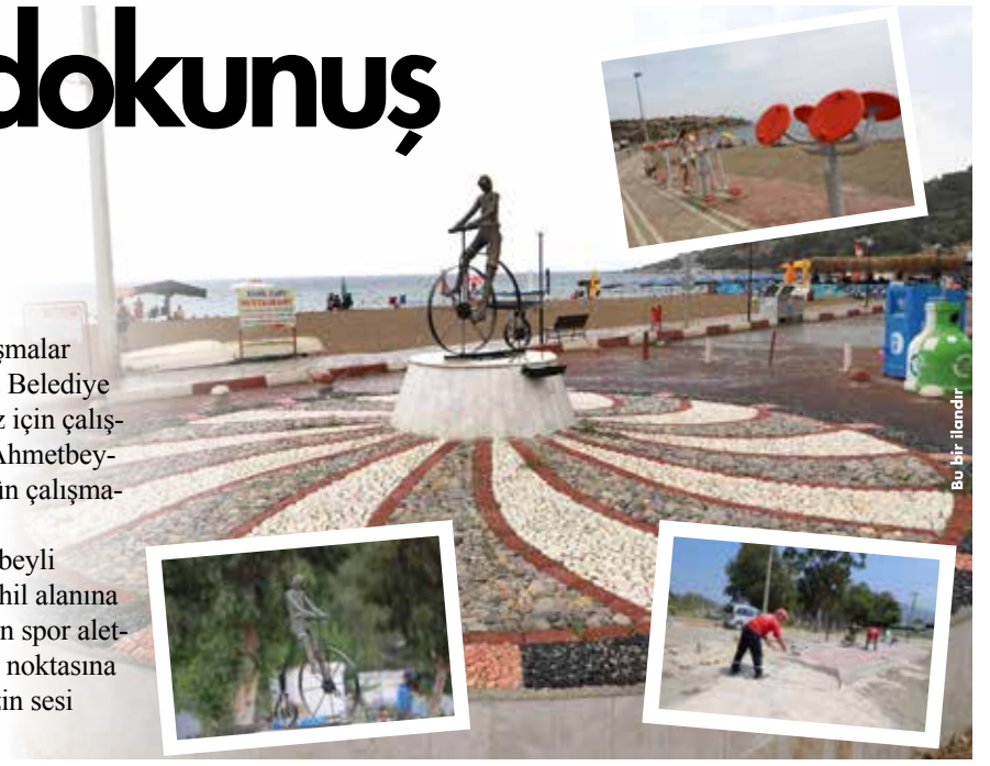
Bu bir ilandır

Yapılan çalışmaları kapsamında Ahmetbeyli kavşağı yeni görünümüne kavuşurken, sahil alanına da vatandaşlarımızın spor yapabilmesi için spor aletlerimizi koyduk. Menderes'imizin her bir noktasına hizmetlerimizi sunmaya, hemşehrilerimizin sesi olmaya devam edeceğiz.